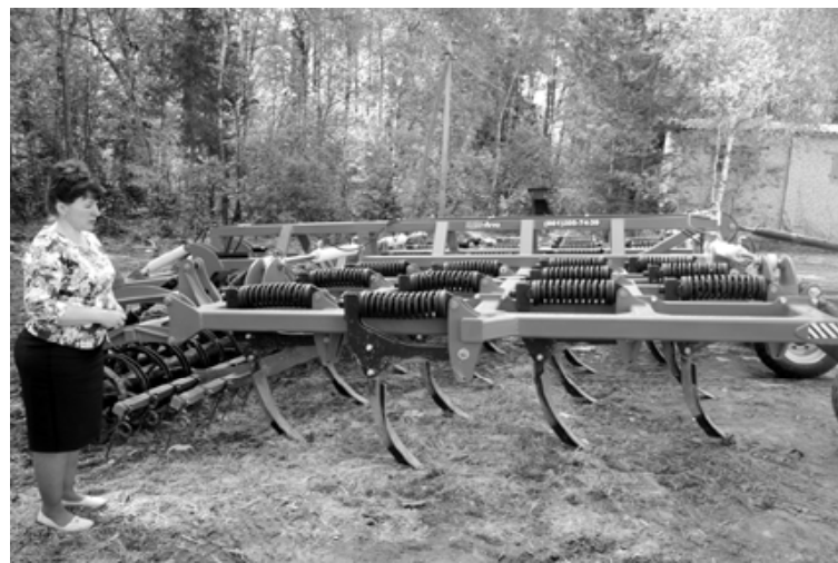
В работе задействуется полный набор прицепных агрегатов

подготовленная почва с внесением органики.